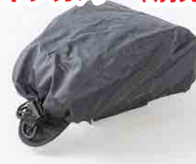
レインカバー(別売:MP-319¥1,080) で突然の雨から大切な荷物を守ります。