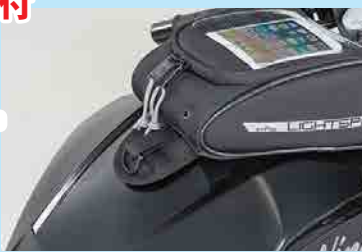
リアマグネットフラップ