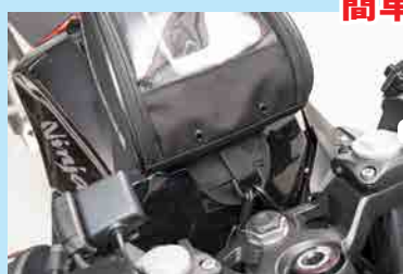
フロントマグネットフラップ+ セフティベルト取付

クリア上面に6インチ程度のスマートフォンの収納が可能。スマートフォン収納部がメッシュ素材なので、大切なスマートフォンを熱から守ります。