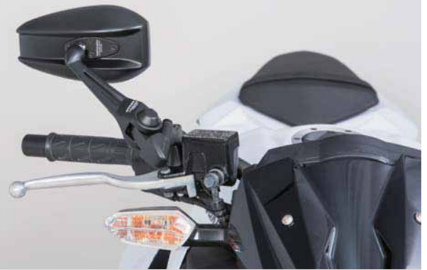
Z250 2016 Inside Position