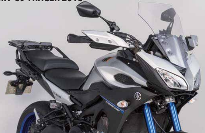
MT-09 TRACER 2016