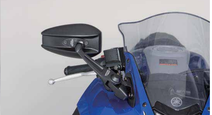
AEX9B YZF-R25 2016 Outside Position