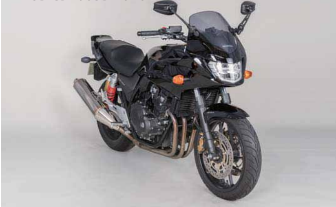
AEX8B CB400SB 2016