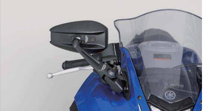
AEX9B YZF-R25 2016 Inside Position