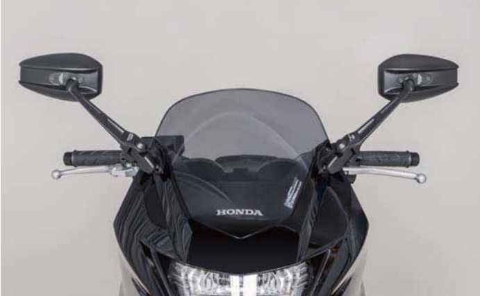
AEX8B CB400SB 2016