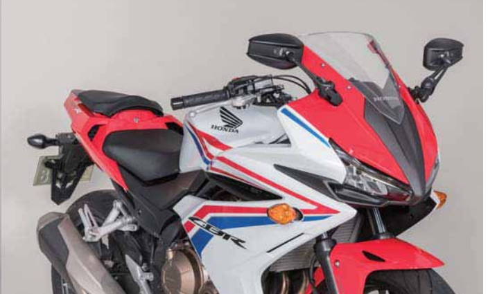
AEX9B CBR400R 2016