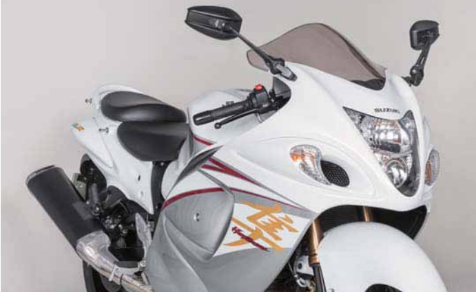
AEX8B HAYASBUSA 2015