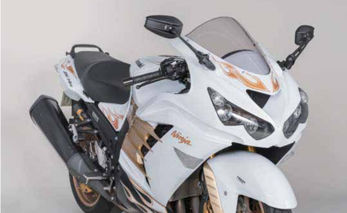
AEX8B ZX-14R 2014